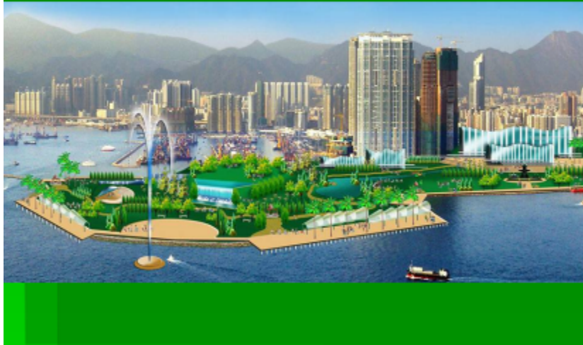
圖一：西九龍文化公園的概念

請問各位，這一塊美麗的土地，是否應該完完整整地發展成香港的『西九綠色文化公園』呢？